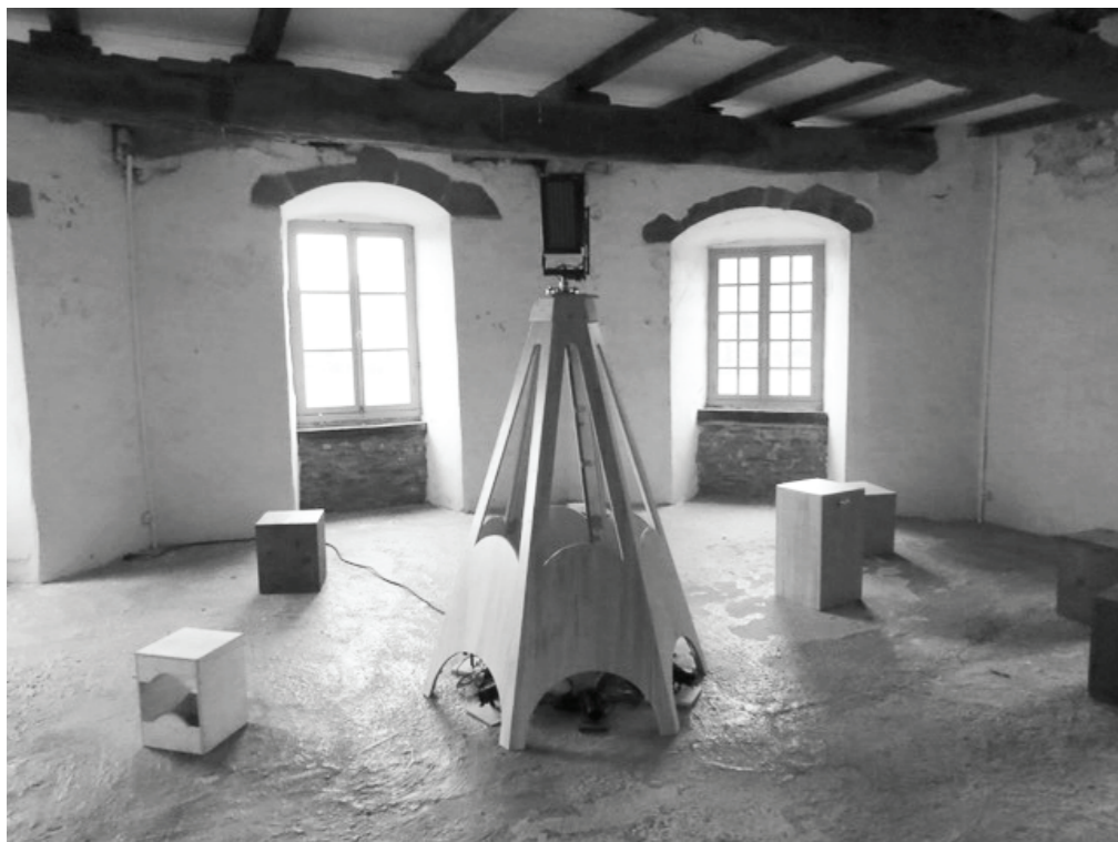
Prototype - Abbaye de Beauport (22)